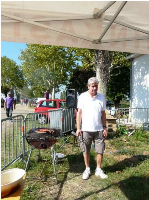
Le poste « saucisses »