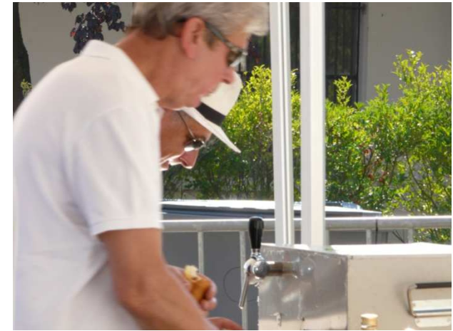
Le poste « bière »