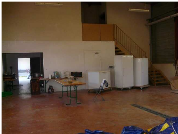
La réserve et l'atelier de confection des sandwichs