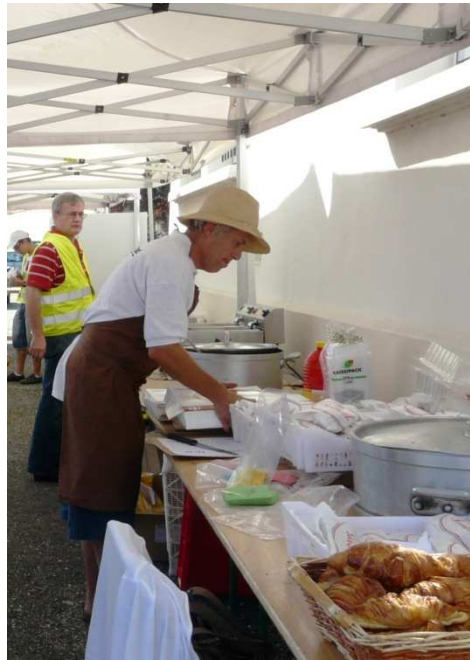
L'équipe « frites »