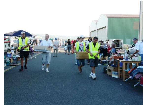
La brigade « nettoyage » à l'action en fin de journée